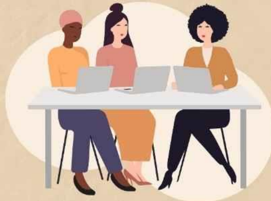
女性の自立・独立 支援での社会貢献