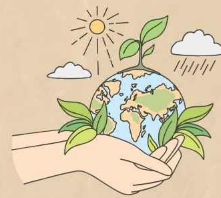
地球の環境促進・ 保護への取組み