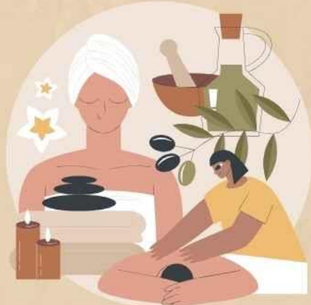
セラピストの育成