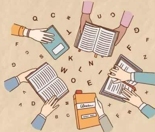
事業持続のための 協力体制