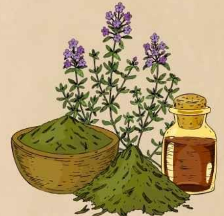
商材の供給・開拓 ・開発事業